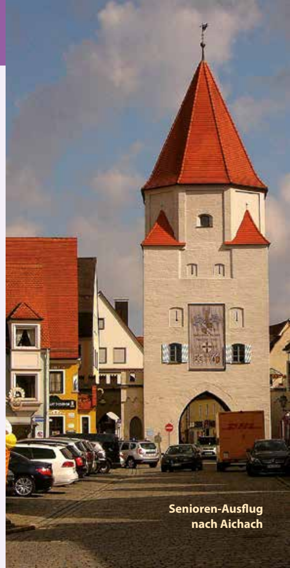
Senioren-Ausflug nach Aichach